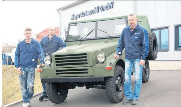
Diese drei Mitarbeiter der Meyer Automobil GmbH in Schlettau waren maßgeblich an der Restauration des Oldtimers beteiligt.

Nun waren im Jahr 2016 einige Veranstaltungen auf. So z.Bsp. das Ostblocktreffen in Püttznitz an der Ostsee. Nun aber schnell Platz räumen, wartet doch schon das nächste Restaurationsobjekt. Ein Geländewagen Sachsenring P2M. Bei alledem sei erwähnt, dass ohne Mechaniker mit Interesse und technischem Geschick